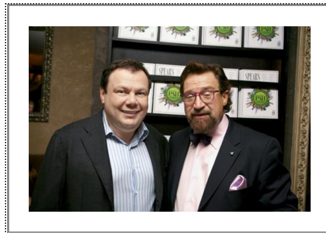
Презентация SPEAR'S Russia Москва, 15 октября 2008 года