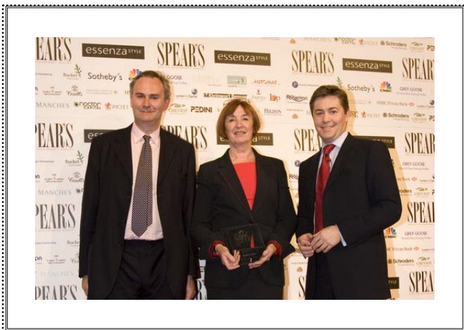
Презентация SPEAR'S Russia Лондон, 29 сентября 2008 года