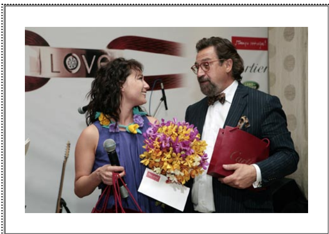
Благотворительный вечер ALL YOU NEED IS LOVE Москва, 16 июня 2009 года